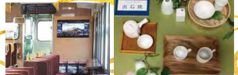
「出石焼」に関する展示 ※運転日により内容が異なります。

※1AB~12ABまで転換クロスシートです。※車両の向きが逆転している場合もあります。