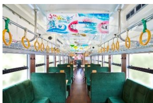
自然を思わせる 落ち着いたインテリア