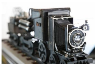
現代アート作家の 作品展示スペース