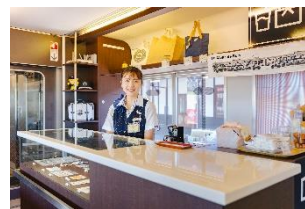
ご当地のいいものを集めた 車内販売カウンター