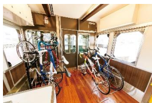
自転車をそのまま積み込める サイクルスペース(要予約)