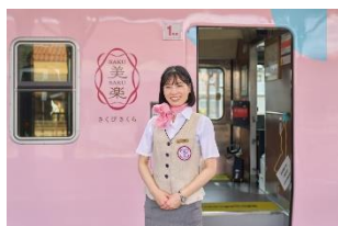
車内アテンダントが 列車の旅をサポート