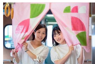
オリジナルの のれんがお出迎え