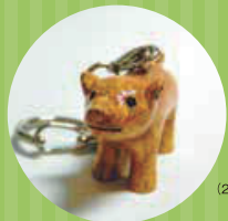
大形埴輪キーホルダー 250円 (2020年6月現在の情報です)

開 9時30分～17時15分(受付は16時30分まで) 関 072(245)6201