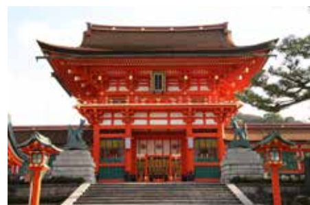
楼門。秀吉が母・大政所の病氣平癒を祈願し、本復御礼に再興された。

伏見稲荷大社は、国内はもちろん海外からの参詣者にも人気の高いスポットのため、とにかく人が多い。混雑を避けることはもちろん、清々しい空気の中でお山めぐりをするためにも、早朝から稲荷山ハイキングをスタートするのがおすすめ。山内にあるそれぞれの摂末社のほか、稲荷山自体が神域なので、登山道を外れることは控えよう。