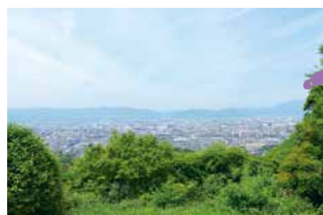
四ツ辻からは京都市内の景色が一望できる。

まるで別世界に来たような心地にさせる千本鳥居は圧巻の一言。延々とお山に続く鳥居をくぐる参道が、お山めぐりの始まり。