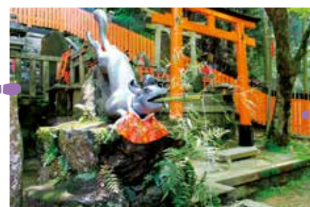
眼病平癒にご利益がある「眼力社」は、御膳谷奉拝所近くにある。狐がくわえた竹から流れる水で手水を。