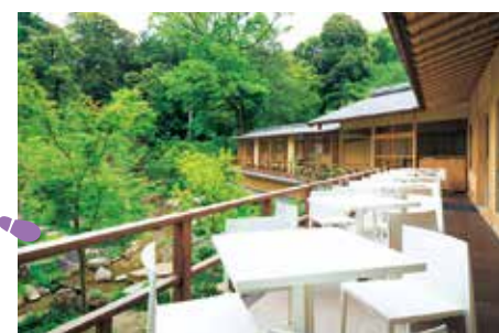
ハイキングの締めには大社内の休憩所・啼鳥菴内にある[稲荷茶寮]に立ち寄り、稲荷パフェ1,300円などの極上のスイーツで疲れを癒やそう。