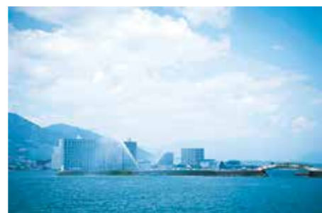
このコースの魅力はなんといってもご覧の開放感!どこまでも続く湖畔の美しい風景に自然と足取りも軽やかになる。