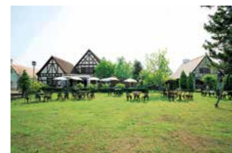
ゴール付近には大津市の姉妹都市であるドイツのヴュルツブルクにちなんだドイツ風の建築物も。