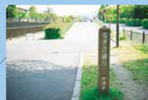
[琵琶湖ホテル]横から[大津プリンスホテル]前へとつながる、なぎさ通り。