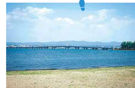
大津市と草津市を結ぶ近江大橋が見えてきたらゴールはもう目の前。