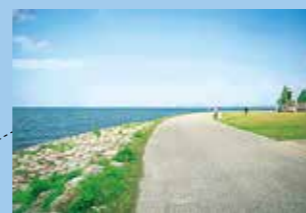
この湖畔ウォーキングコースはビギナーにもおすすめのライトなコース。