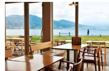
個性豊かな4つのカフェからなる[なぎさのテラス]は、コースの中盤あたりにある。カフェのセレクトも楽しみのひとつ