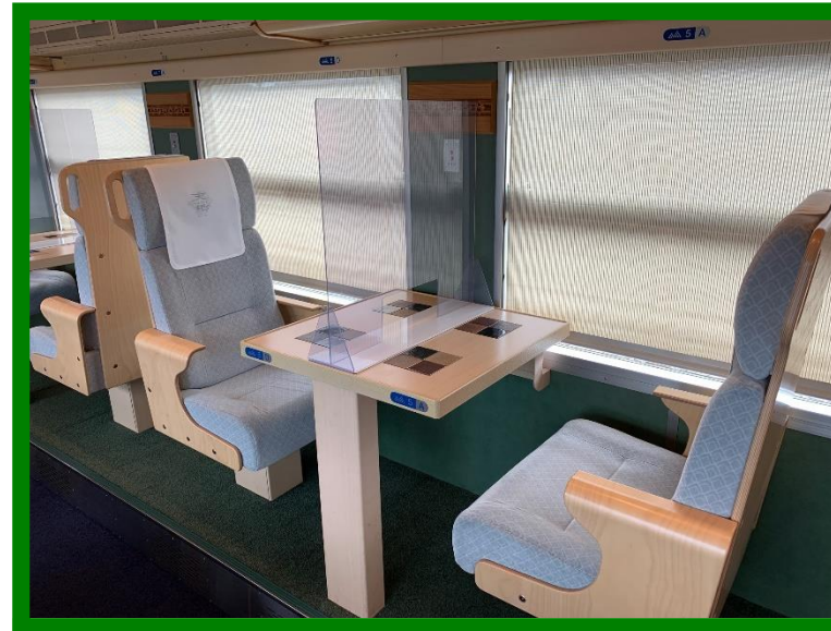
ボックス席 (2人掛け)