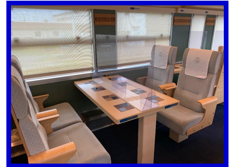
ボックス席 (4人掛け)