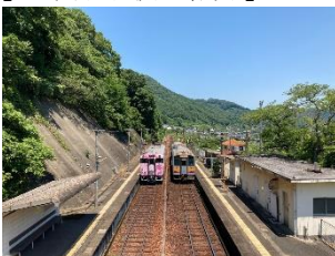
牧山駅(岡山市) 山と川に挟まれて雄大な自然がお出迎え