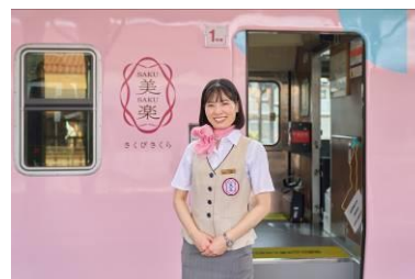
車内アテンダントが沿線の案内や車内販売などお客様の旅をサポート