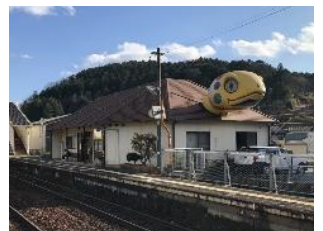
亀甲駅(美咲町) インパクトのある大きな亀の駅舎がお出迎え