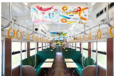
岡山県北エリアの山や森で過ごすイメージの落ち着いた内装デザイン