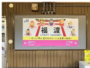
福渡駅(岡山市) 縁起のよさそうな七福神の駅名看板がお出迎え