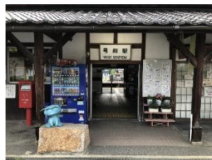
弓削駅(久米南町) 県内最古級の木造駅舎と川柳がお出迎え