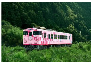
淡いピンク色の車体に沿線の四季折々の花びらをイメージした外装デザイン