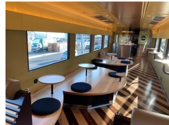
4号車フリースペース