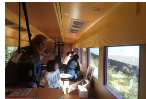
ジオパークガイド解説