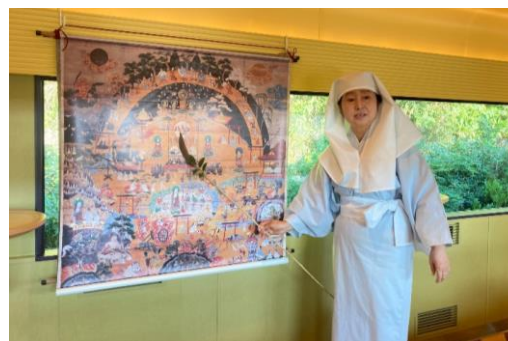
熊野曼荼羅絵解き