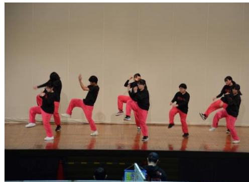
沿線学生のダンス披露